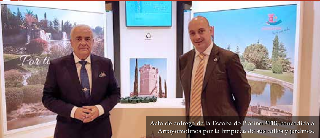
Acto de entrega de la Escoba de Platino 2018, concedida a Arroyomolinos por la limpieza de sus calles y jardines.