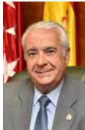
D. Carlos Ruipérez Alcalde Presidente @carlos_ruiperez

Entrevista concedida a Canal 33 donde el Alcalde habló sobre la actualidad de Arroyomolinos y de sus proyectos de gobierno.