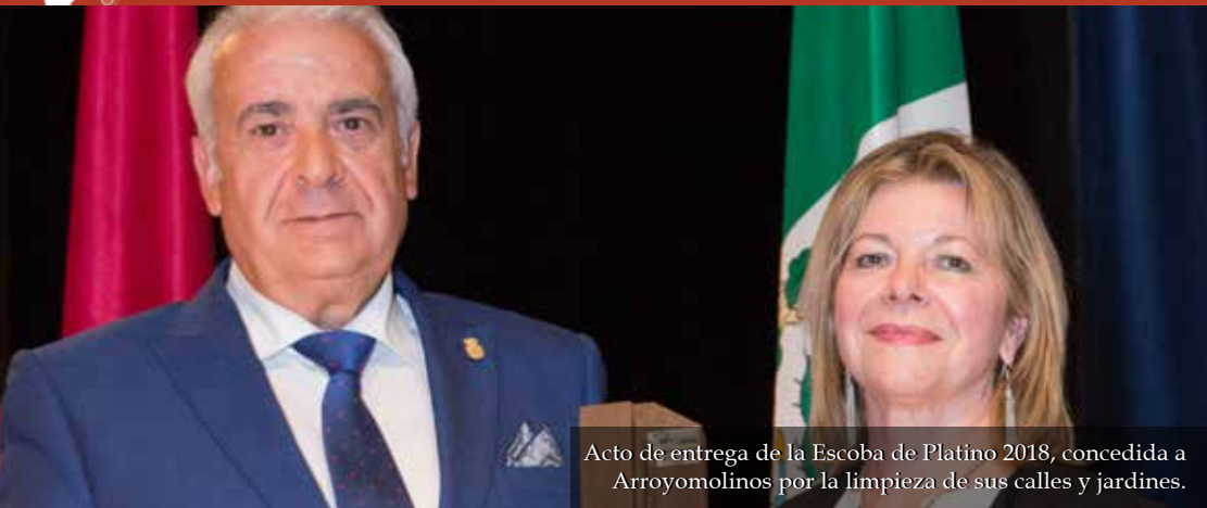
Acto de entrega de la Escoba de Platino 2018, concedida a Arroyomolinos por la limpieza de sus calles y jardines.